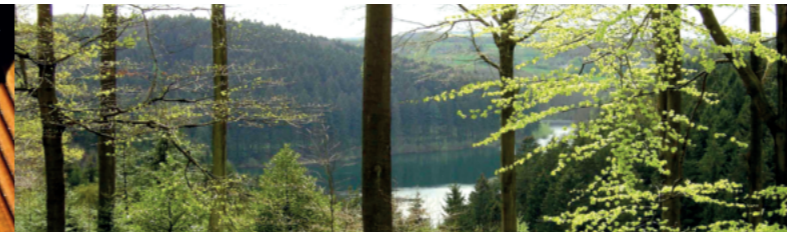
Mischung von Laub- und Nadelholz (9)