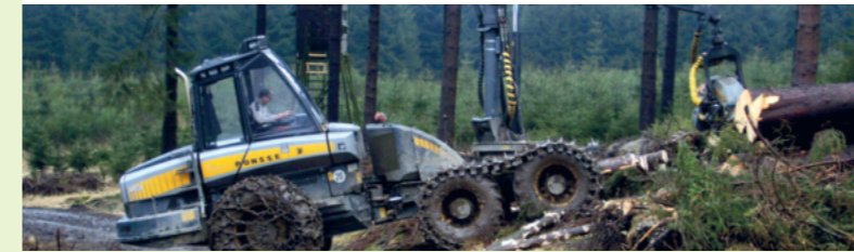
Freiräumen der benötigten Transport- und Rettungswege (4)

Weitergabe an Regionalforstamt/Holzvermarkter!