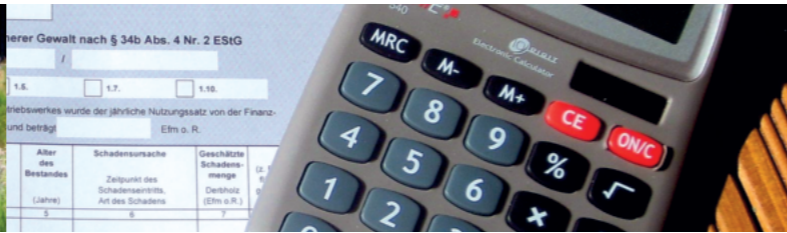
Steuerliche Aspekte bei Kalamitäten (8)